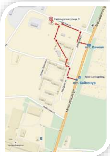
СХЕМА МЕСТОНАХОЖДЕНИЯ УМЦ ГОЧС КАЛУЖСКОЙ ОБЛАСТИ

Государственное казенное образовательное учреждение дополнительного образования «Учебно-методический центр по гражданской обороне и чрезвычайным ситуациям Калужской области»